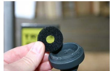
Kuva 2. Suodatin