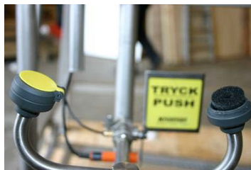
Kuva 1. Suutin avattuna